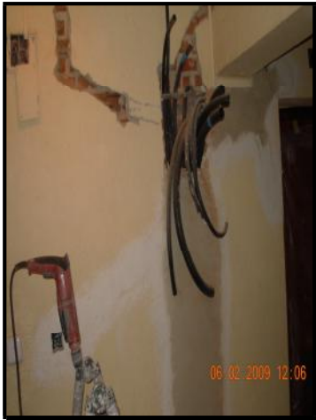
Rozas y calas en rellanos para Canalizaciones de la reforma eléctrica.