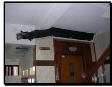
Canalizaciones Derivaciones Individuales en portal.