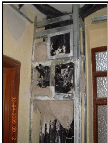
Realización de mochetas o Falsos pilares para tapado de canalizaciones.