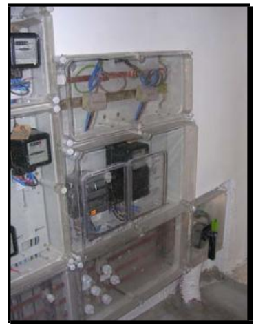
Centralización de contadores Acabada