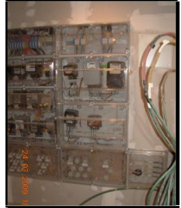
Centralización de contadores