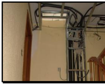
Detalle de Canalizaciones de las Derivaciones Individuales.