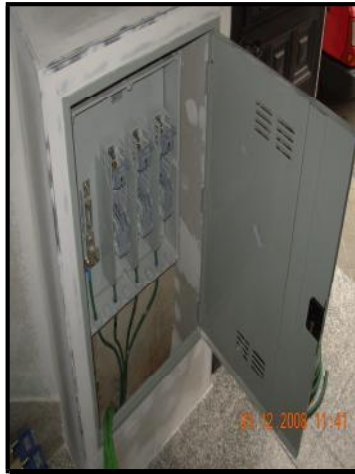
Caja General de Protección en Acometida.