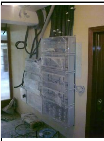
Fase de la instalación de la Centralización de Contadores.