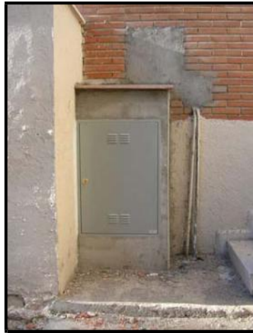
Caja General de Protección Acabada