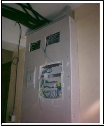
Mochetas y falsas vigas acabadas de albañilería