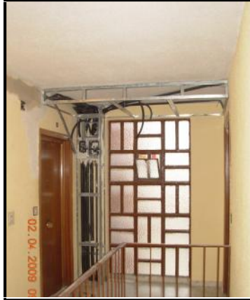
Falsas vigas en portal