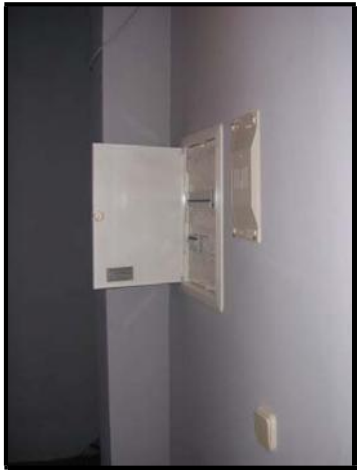
Cuadro General de Distribución de la finca acabado