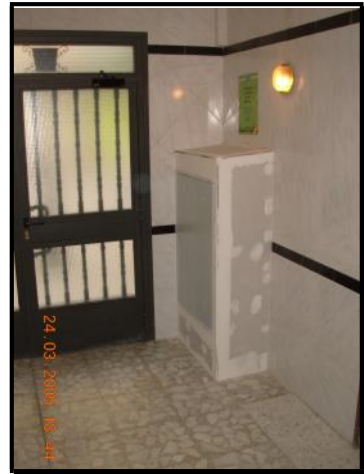
Realización del mechinal en C. G. P. con puerta homologada.