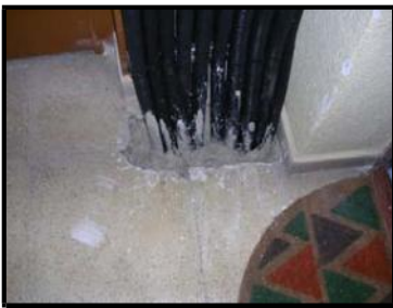
Calas en forjados y cortafuegos de obligada realización.